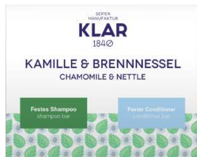
Kamomilla - Nokkonen

Golden Boheme / Rock'n'Roll Baby / Flower Power