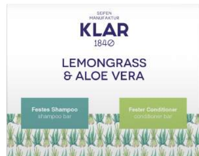
Sitruunaruoho- Aloe Vera